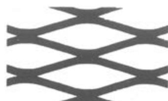
S2/S17-S28 (10 x 43 mm)