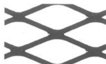
S27 (17 x 43 mm)