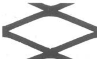
53-54-S2D (20 x 60 mm)